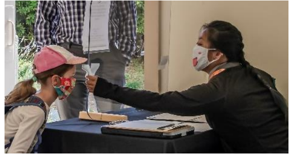
فحوص درجة الحرارة.